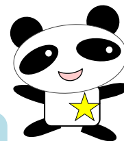
ハローワーク梅田 マスコットキャラクター うめパンダ

○大阪市障害者就業・生活支援センター相談コーナー 面接を受ける方のワンポイントアドバイスもやっています。