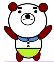
ハローワーク大阪東 マスコットキャラクター ひがしくん