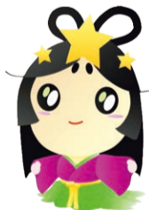
交野市 おりひめちゃん