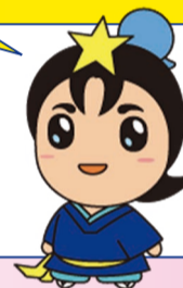
枚方市 ひこほしくん