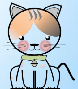
見守りキャットきすなちゃん