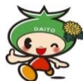
大東市イメージキャラクター「ダイトン」